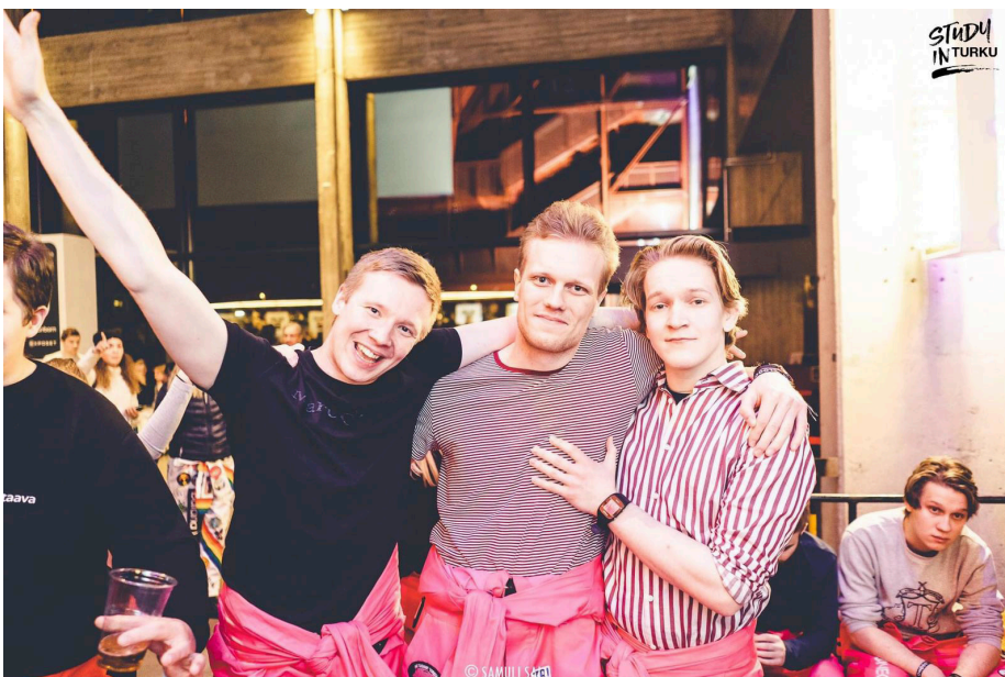
Kuvan innokkaat opiskelijat eivät liity tapaukseen.

Huolimatta viittauksesta makropuolelle, antaa vahva tilastomatemattinen osaaminen myös erin-